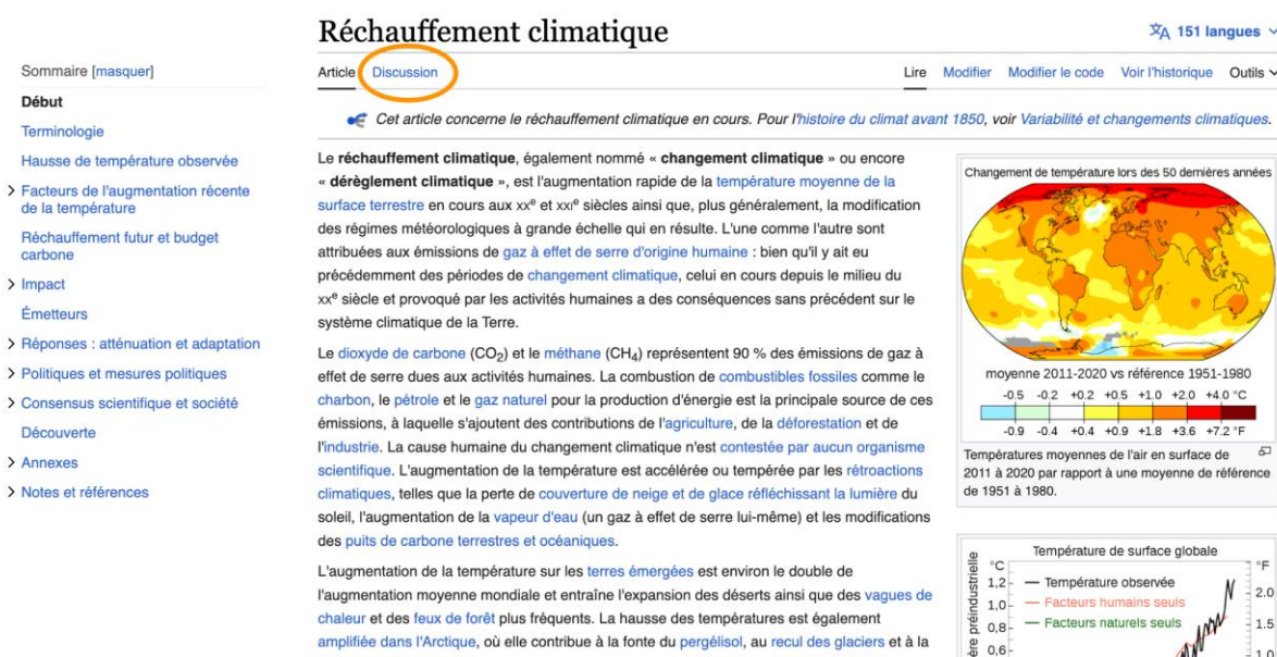
Figure 1 : Article Wikipédia Réchauffement climatique

Si Wikipédia est devenu au fil du temps l’un des dix sites les plus consultés dans le monde, ses articles encyclopédiques sont bien sûr davantage connus que ses espaces de discussion. Pourtant, chaque article s’accompagne d’une page de discussion, comme le montre la Figure 1.